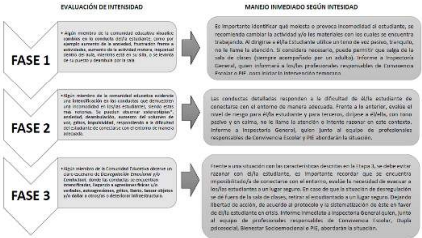
Figura 1: En la siguiente figura indica las fases de una Desregulación Emocional y/o Conductual (DEC) en función del grado de intensidad y el bordaje de la DEC en función de esta: